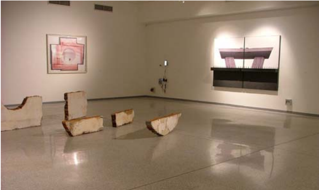
Veduta parziale della mostra