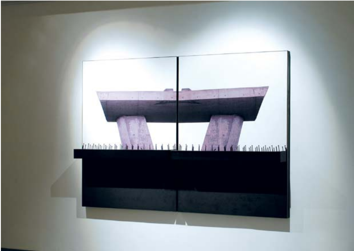
Ulrich Egger – Mi/To