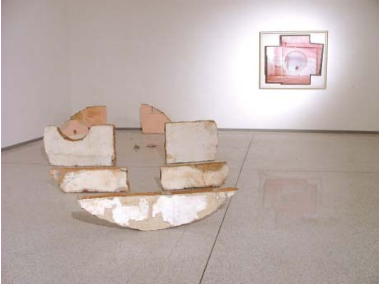
Giorgio Andreotta - Sunset Blvd 1/5