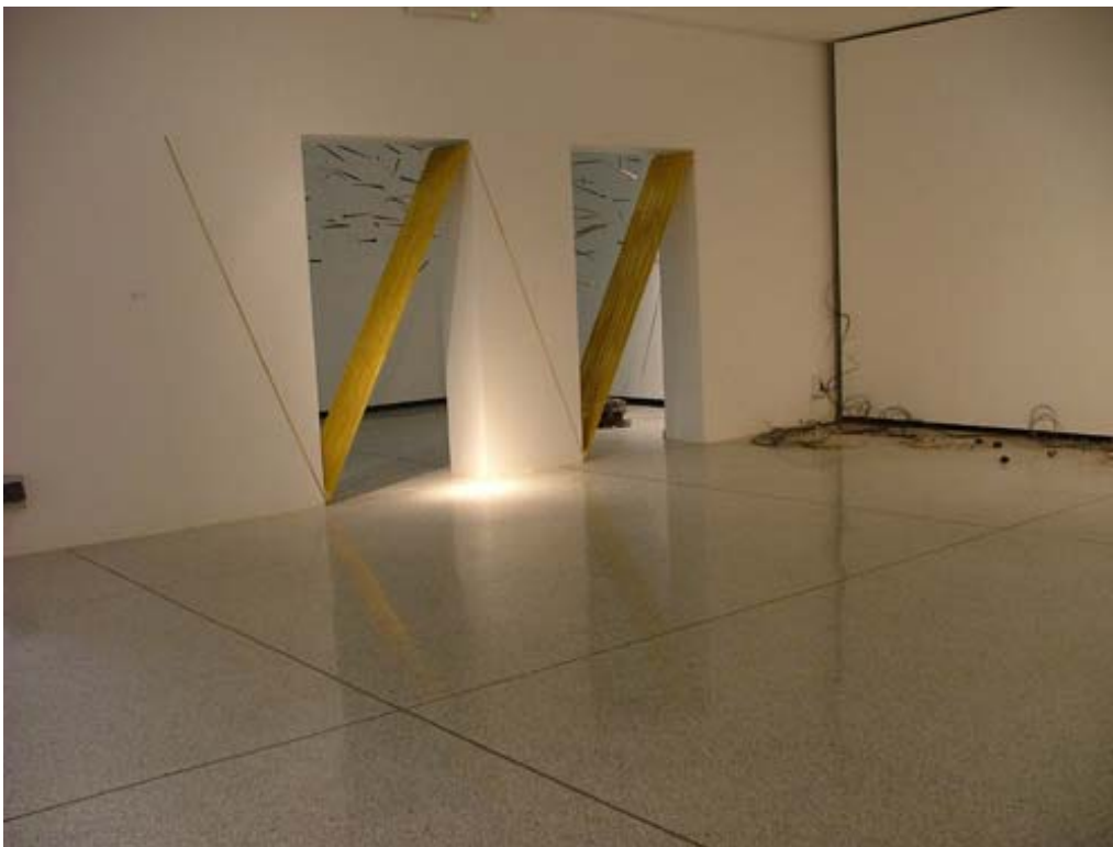
Veduta parziale della mostra