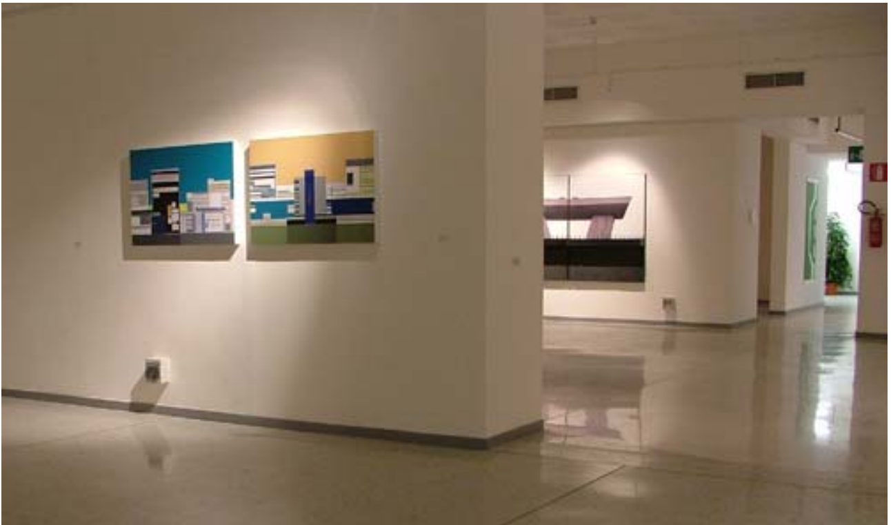
Veduta parziale della mostra