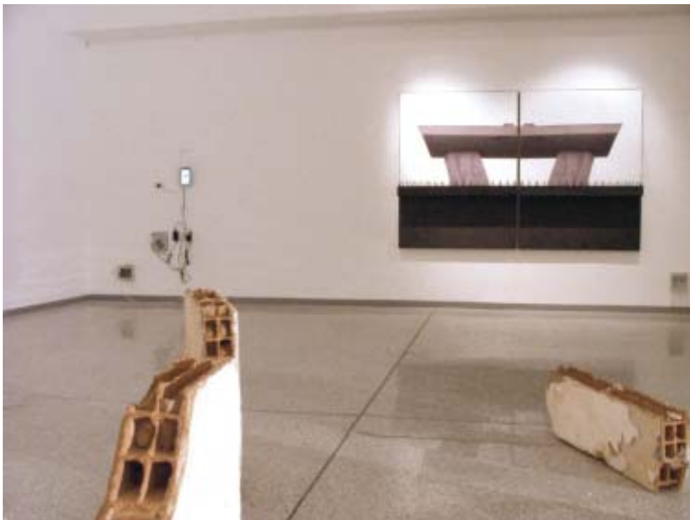
Veduta parziale della mostra